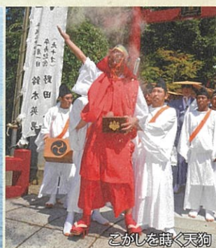
こがしを時く天狗