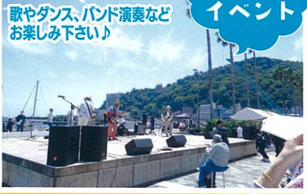
歌やダンス、バンド演奏などお楽しみ下さい♪