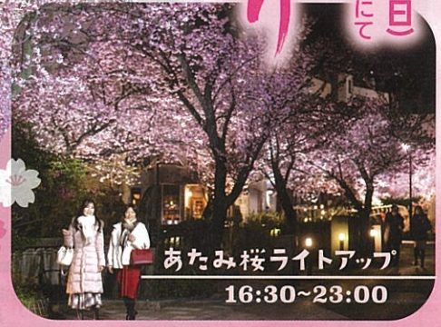
あたま桜ライトアップ 16:30～23:00