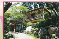
中山晋平記念館 【開館時間】10:00~16:00